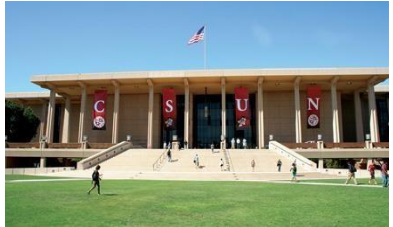
Biblioteca Central da California State University

Solicite seu Application e tire suas dúvidas por telefone ou e-mail: