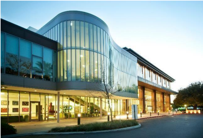
New Campus Center da University of La Verne